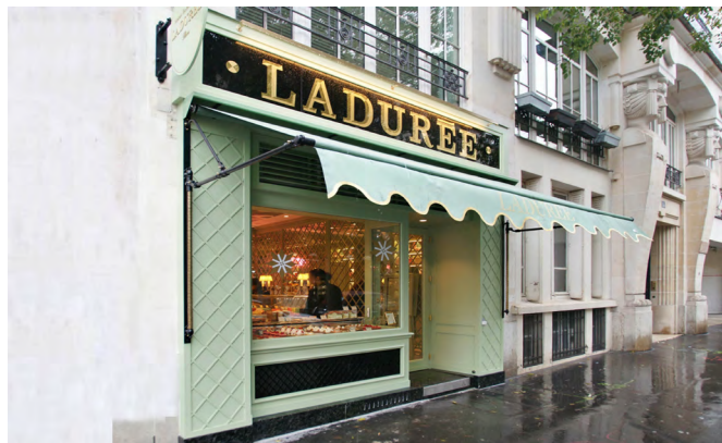
14, rue de Bretagne - Paris 3 ème