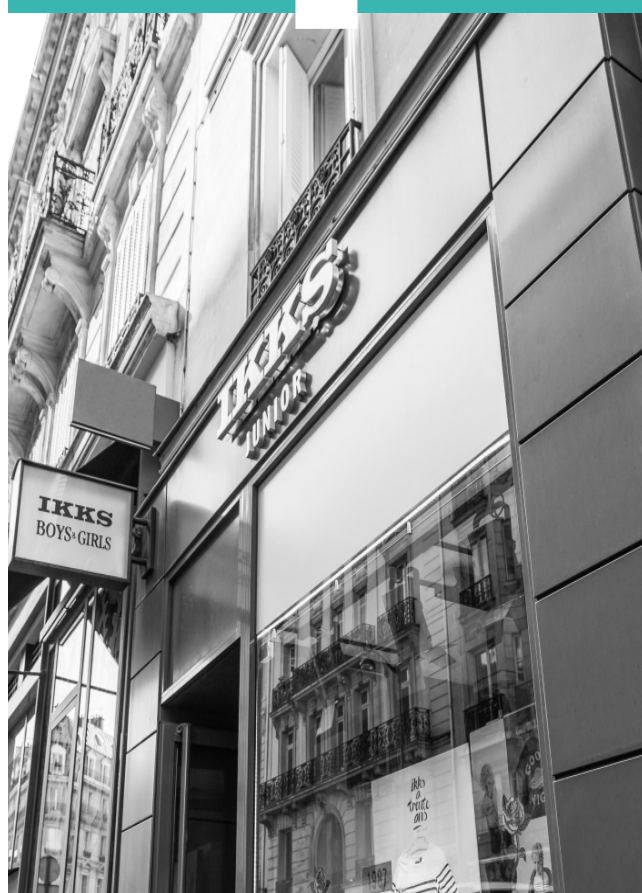
32, rue du Four - Paris 6 ème

Affinités Pierre est une SCPI (Société Civile de Placement Immobilier) à capital fixe destinée à des investisseurs désireux d'accéder à l'immobilier d'entreprise.