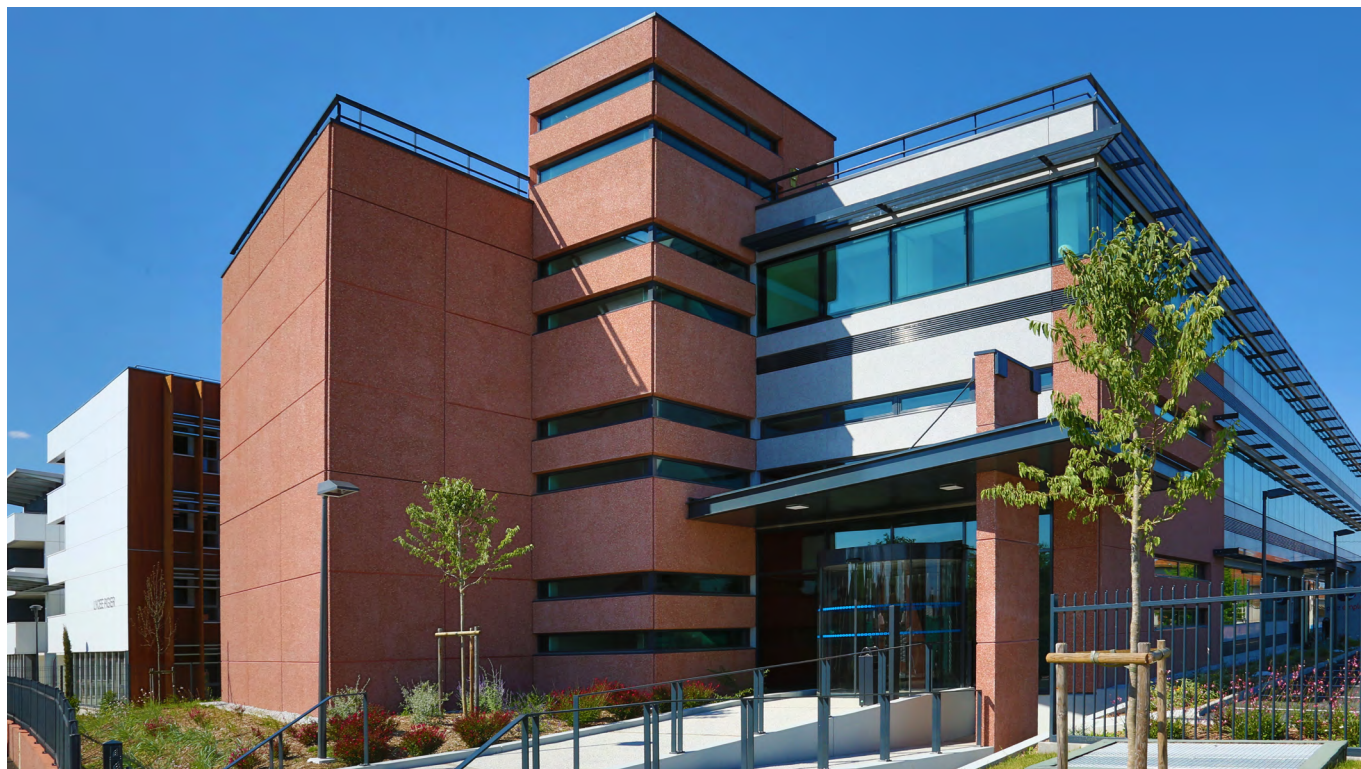
4, rue Française d'Eaubonne - Toulouse

Tout investissement dans une SCPI comporte notamment les risques suivants :